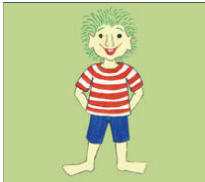
Quadrich kennt sich aus. Der kleine Mann im Ringelhemd ist immer unterwegs und hat sich in seiner Heimat umgesehen. S. 5