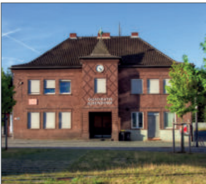
Ein Bahnhof für alle. Am 29. März wird Gleis 11 als Treffpunkt im Herzen des Stadtteils eröffnet. S. 6