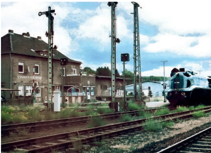
▲ Im Jahr 2000 fuhr der Rheingoldexpress am Bahnhof ein.