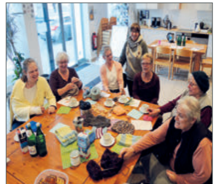
Handarbeitsgruppe, Internationales Frühstück, Sprach- und Spielkurse. Im StadtteilLaden ist ne Menge los. S. 9