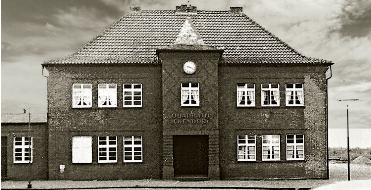
▲ Gardinen zieren die Fenster des Bahnhofs im Jahr 1928. Als damals der erste Zug einfuhr, waren nicht nur die Kinder aufgeregt.